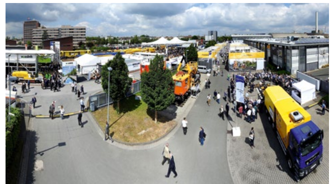
Ausstellungsgelände / Exhibition grounds