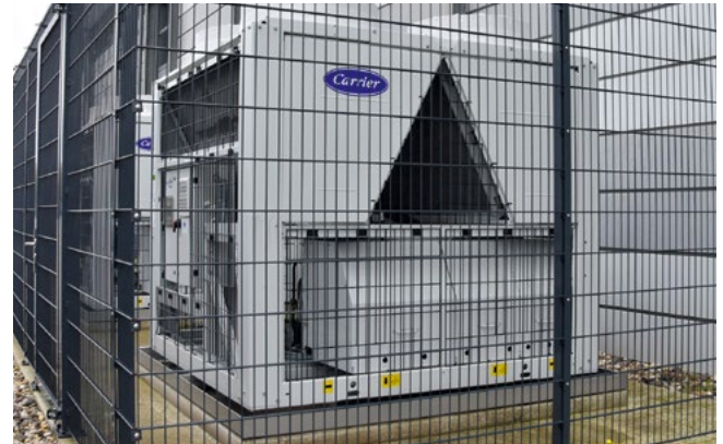
Die neue Klimaanlage für die Messehalle Süd.

There is also interesting news with regard to our facilities from the point of view of protection against infections. Namely, the hygiene and infection protection measures we developed and implemented in the context of the pandemic have been successfully hygiene-certified by an independent hygiene institute and we have had our ventilation systems tested by the Deutsche Theater-technische Gesellschaft (DTHG), which has now also certified that our premises are „pandemic-compatible“.